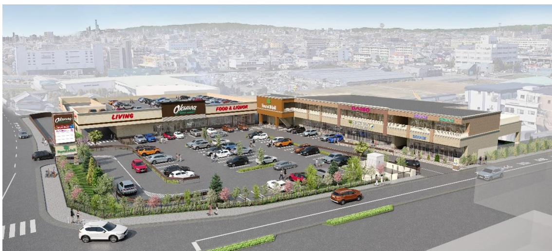
「フォレストモール八尾」イメージ

弊社はアメリカ西海岸の商業施設をモデルとし、地域に根ざした近隣型ショッピングモールを開発・運営しております。当施設は、利用しやすい駐車場スペースの確保、統一感のある建物デザイン、憩いを感じられる植栽を備え、近隣住民の日常生活をより豊かにすることをモットーとした商業施設となっております。